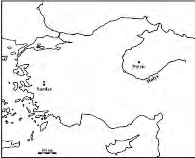
Fig. 1: Cours actuel de l'Halys/Kizilirmak (DAO K. Leloux).

Voici donc la seule mention où l'Halys marque la frontière entre l'empire mède et l'empire lydien. Néanmoins, ce passage mérite que l'on s'y attarde. En effet, si l'on compare le cours de l'Halys décrit par Hérodote avec celui du Kizilirmak aujourd'hui ( Fig. 1 ), nous constatons que la description qui nous en est faite est assez problématique.